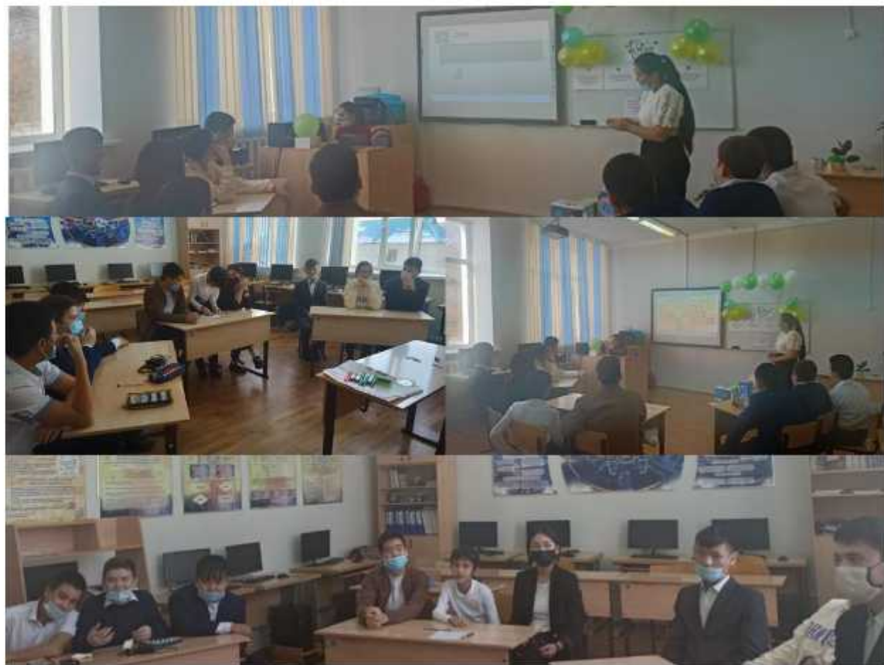
«МИФ» үздігі қорытынды кеші 8 – 10 сыныптар арасында