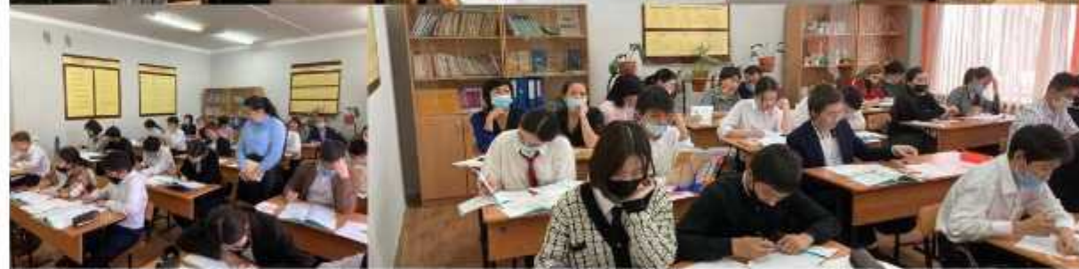
Арифметикалық прогрессия. Арифметикалық прогрессияның n – ші мүшесінің формуласы 9Б сыныбы Алгебра пәні