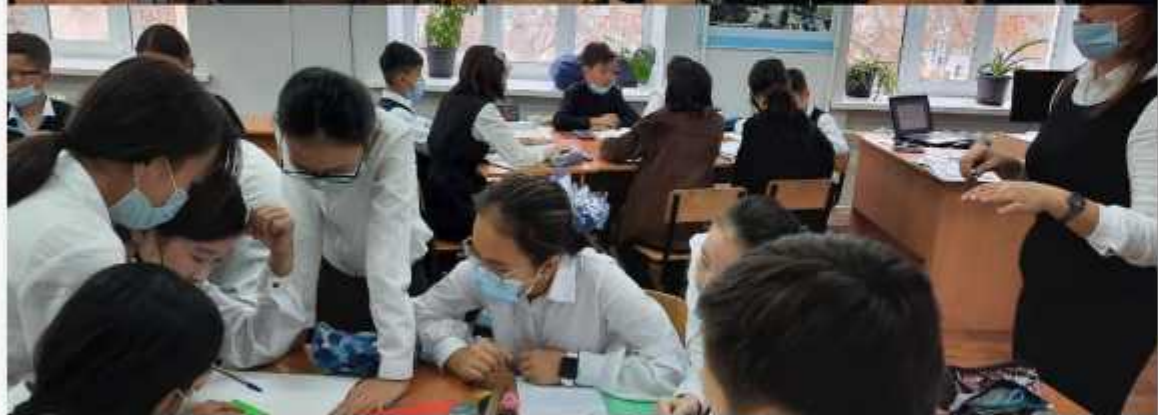
Үшбұрыш және оның түрлері 7А сыныбы Геометрия пәні