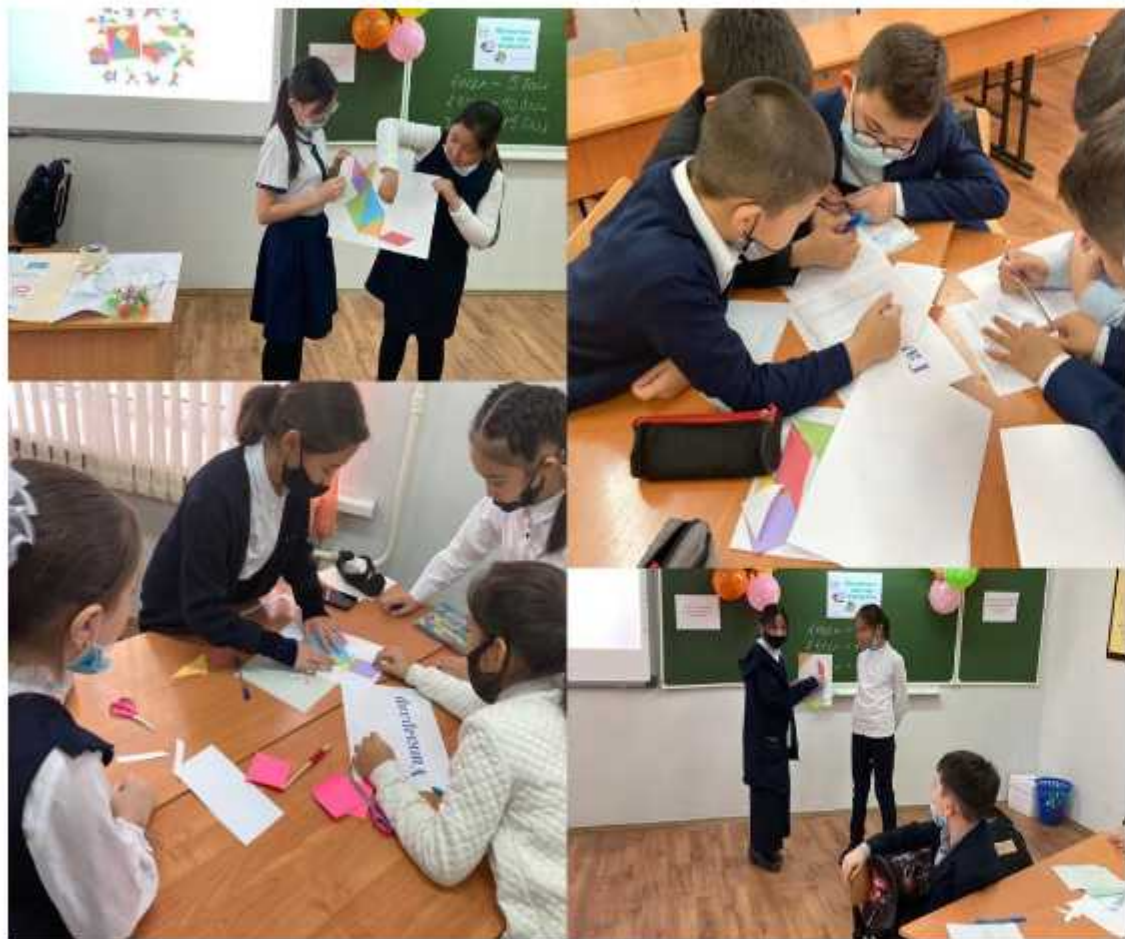
«Математика - өмір сүру формуласы» сыныптан тыс шара 5 - 6 сыныптар арасында